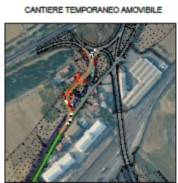
CANTIERE TEMPORANEO AMOVIBILE